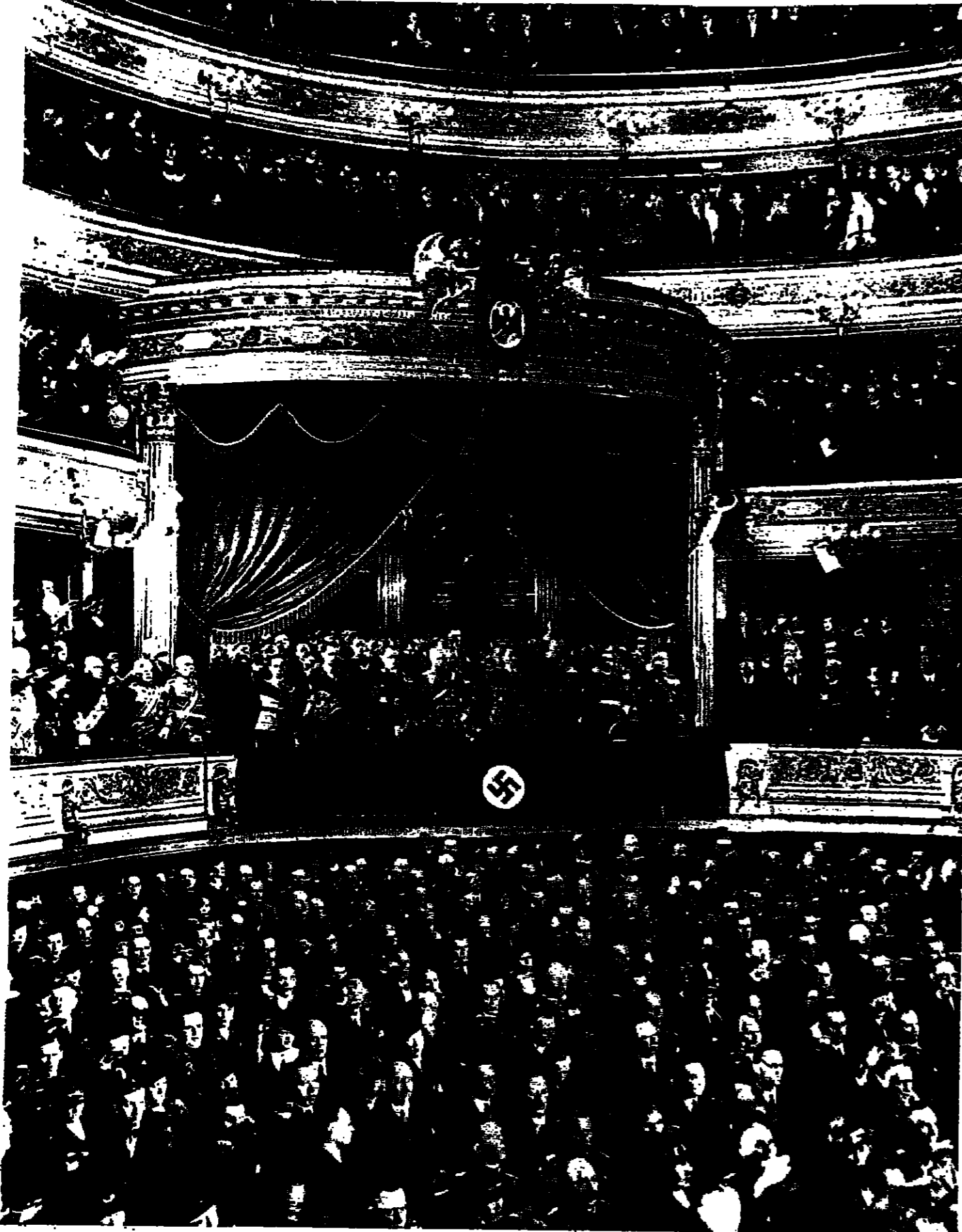
هتكر واركان جريه يحضرون عرضاً عن حرب ١٩١٤ في اوبرا برلين .